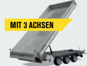
MIT 3 ACHSEN

Kann mit einem Gesamtgewicht von 3.500 kg bis zu 2.700 kg geliefert werden.