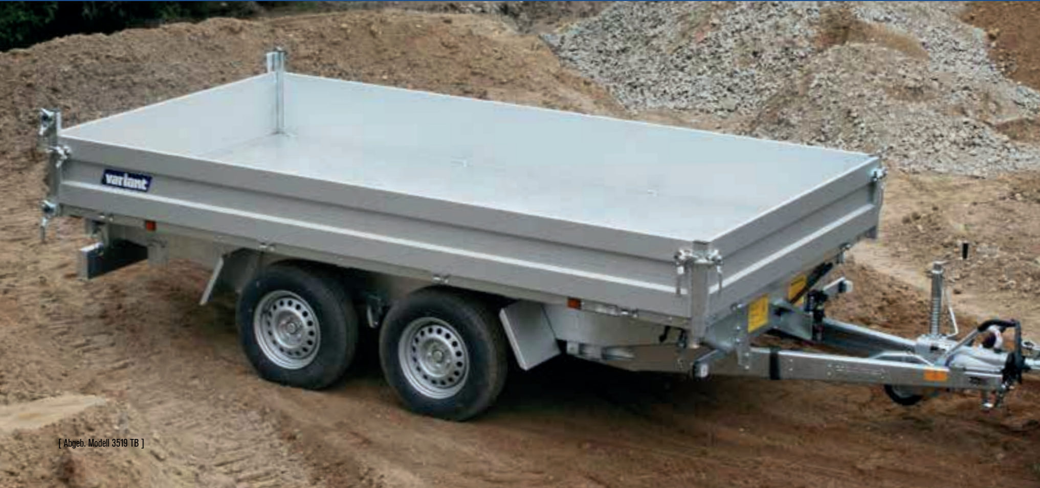
[ Abgeb. Modell 3519 TB ]

Das Kippen der Ladefläche erfolgt durch Betätigung der Kabel-Fernbedienung. Eine drahtlose Fernbedienung und eine Steuerung durch Smartphone kann zugekauft werden.