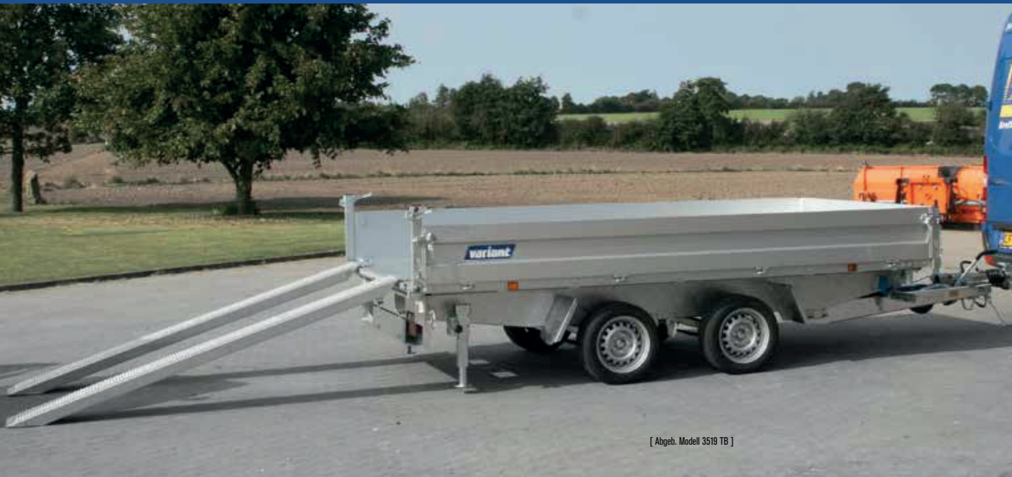
[ Abgeb. Modell 3519 TB ]