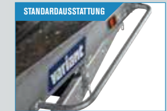
STANDARD-AUSSTATTUNG Fahrradschutz für die Sicherheit. Kann auch für das Aufsteigen benutzt werden.