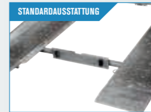
STANDARD-AUSSTATTUNG Stahlboden mit nach oben gehenden Löchern. Stark und Rutschfest.

Eine leichte und unbeschwerte Auffahrt von Fahrzeugen ermöglicht der komplette Stahlboden zusammen mit der hydraulischen Verstellung und der Rückwärtsplatte. Radzurr Gurte und Radstopper sind auch ein Teil der Extra-Ausstattung. Die ganze Serie wird auch mit 14" Hochprofilrädern angeboten. Für Modell 3504 A4 entsteht kein Mehrpreis.