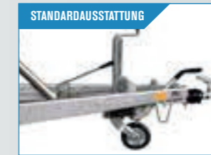
STANDARD-AUSSTATTUNG Hydraulischer Kipp und Stützrad. Ladefläche wird mühelos hochgepumpt und fixiert.