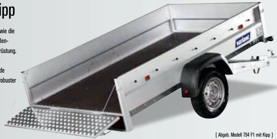
[ Abgeb. Modell 754 F1 mit Kipp ]

Model 754 / 1304 F1 mit Kipp haben beide Stoßdämpfer bei der Kipp-Funktion und robuster Rückklappe und Scharnieren.