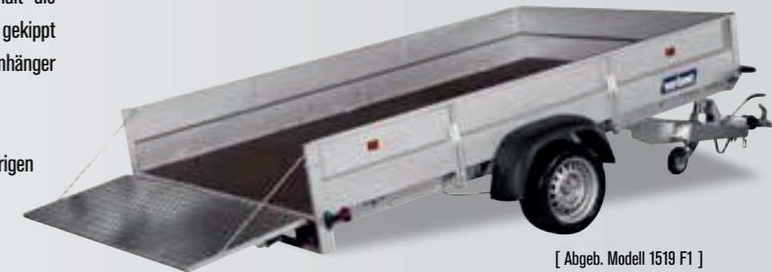
[ Abgeb. Modell 1519 F1 ]

Kräftiges Stützrad in der Front ist Standard. Als Extra-Zubehör können Sie auch 2x geriffelte Auffahrbahnen und ein LED-Leuchten-Set erhalten, sowie Aluboden, Hochplane, etc., dazukaufen.