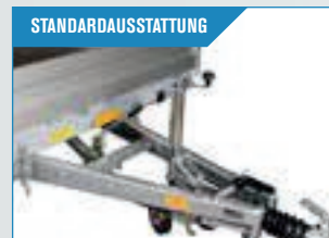
Automatikstützrad, Pumpe für die Hydraulik und eine kräftige Kugelkupplung.