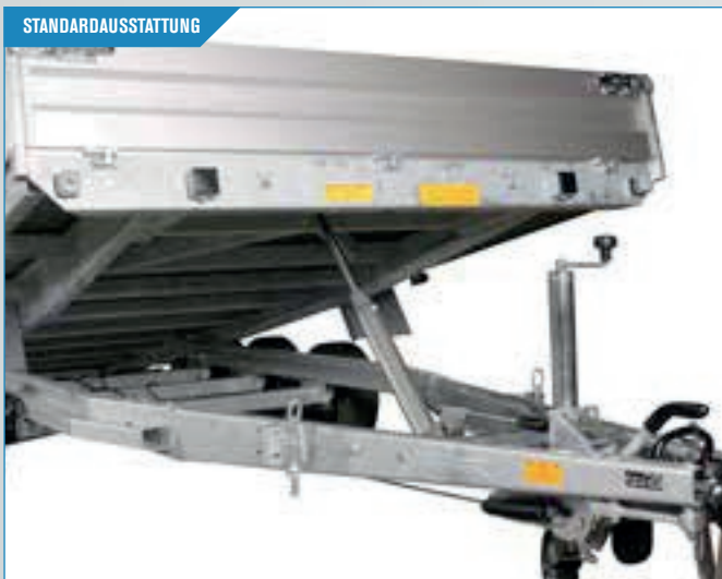
Kippvorrichtung mit kräftigem Stempel und manueller Handpumpe. Sicher und stabil.