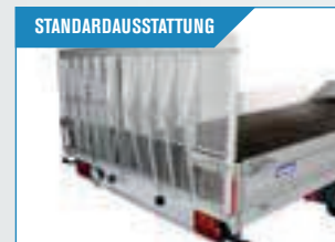
Kräftige Heckrampe mit Gasfeder. Robuste Verschlussbeschläge halten die Rampen fest.