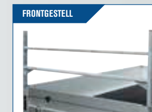
FRONTGESTELL Feuerverzinktes Gestell für Befestigung von Gütern. Montiert in den Ecken. Höhe 70 cm.