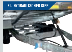
EL.-HYDRAULISCHER KIPP Komplett mit eingebauter Batterie und Ladegerät. Wird mit Fernbedienung mit Kabel geliefert.