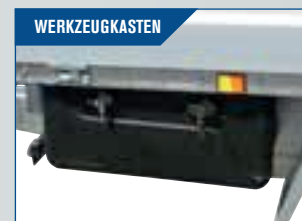
WERKZEUGKASTEN Robust, mit Schloß. 55x25x30 cm (BxTxH). Grösse 75x30x36 cm (BxTxH) kann auch montiert werden.