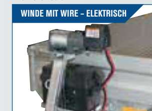
WINDE MIT WIRE - ELEKTRISCH Montiert auf Abnehmbare Konsole. Zugkapazität 1.814 kg. m/Batterie und Batteriebox.