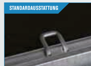
Innenliegende Verzurrösen, herunterfallend im Rahmen. Praktisch und robust.