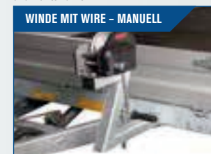
WINDE MIT WIRE - MANUELL Montiert auf Abnehmbare Konsole. Zugkapazität 900 kg.