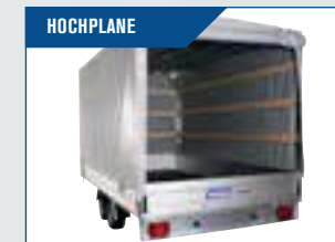
HOCHPLANE Kräftige Qualität mit Öffnung in der Seite und Rückseite. Geschweißtes Gestell. Innenhöhe 205 cm.