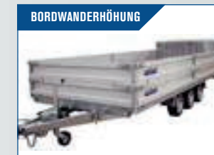
BORDWANDERHÖHUNG Erhöhen das Raumvolumen vom Anhänger. Klappbar und abnehmbar.