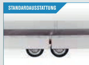
Klappbare und abnehmbare Seiten. Mittel- und Eckpfosten können ohne Werkzeug entfernt werden.