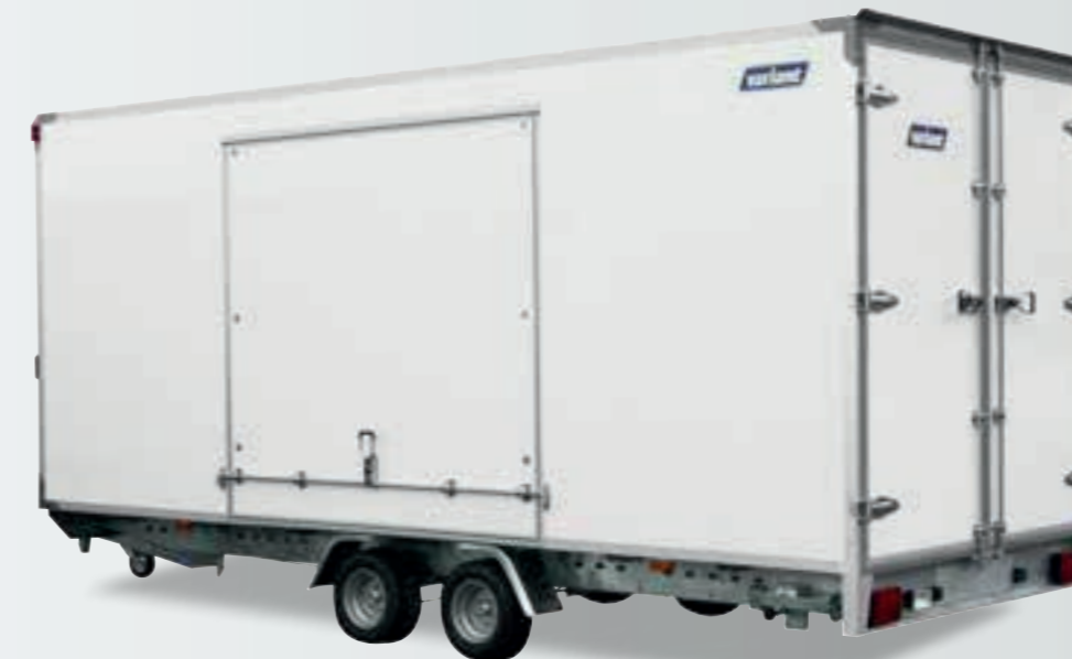
[ Abgeb. Modell 3021 C5 mit Verkaufsklappe und stützbein - Extra-Zubehör. ]

Kann mit einem Gesamtgewicht von 3.500 kg bis zu 2.700 kg geliefert werden.