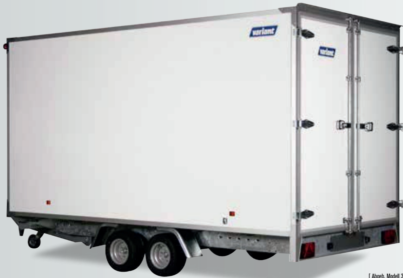
[ Abgeb. Modell 3021 C4 ]

Alle mit 52 mm starken Sandwich-Polyester Paneelen aufgebaut und mit Doppeltüren mit doppelten Drehstangenverschluss