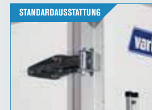
STANDARDAUSSTATTUNG Aluprofile und Scharniere in robuster Qualität.