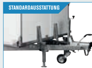
STANDARDAUSSTATTUNG 4 kräftige Stützbeine und kräftiges Stützrad. Der 752 DK2 hat 2 leichte Stützbeine und gewöhnliches Stützrad.