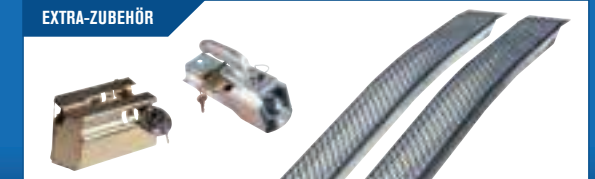
EXTRA-ZUBEHÖR Verschluss, Auffahrrampe u.a. Große Auswahl von Zubehör für den Anhänger.