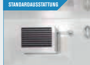
STANDARDAUSSTATTUNG Innen LED Leuchte mit Sensoren und Aggregat. Vollendet das Erlebnis.

Kann mit einem Gesamtgewicht von 2.700 kg bis zu 1.600 kg geliefert werden.