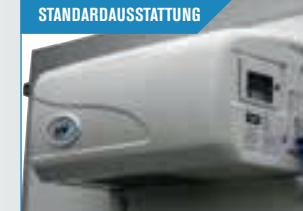
STANDARDAUSSTATTUNG Kräftiges Kühl Aggregat. Das kann von einer Raumtemperatur +10 Grad bis 0 Grad kühlen.