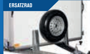
ERSATZRAD Wird an der Stirnwand montiert. Ist immer gut, es dabei zu haben.