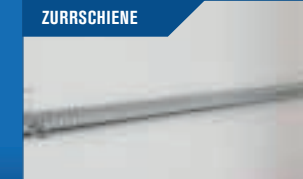
ZURRSCHIENE 2 Stück werden an den Längsseiten montiert. Querstange kann zugekauft werden.