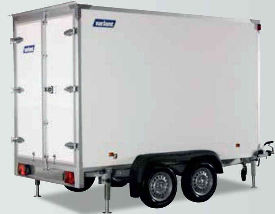
[ Abgeb. Modell 2005 K3 ]

Alle Modelle können von einer Raumtemperatur +10 Grad bis 0 Grad kühlen.