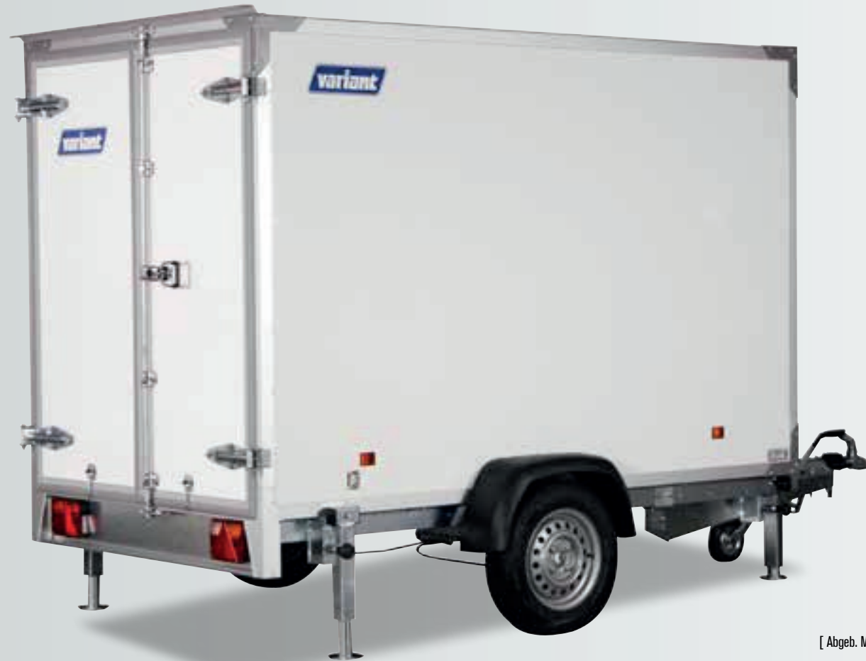
[ Abgeb. Modell 1315 K2 ]

Super starke Sandwich Konstruktion mit hoher Isolierfähigkeit