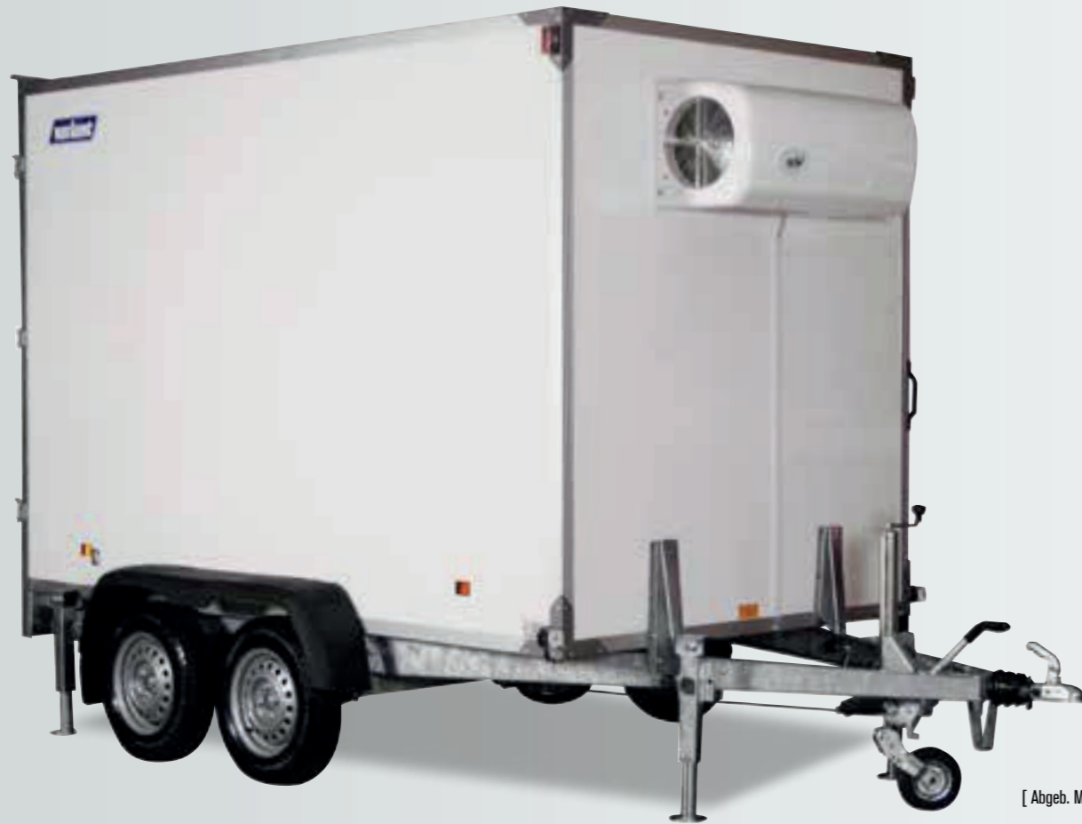
[ Abgeb. Modell 2017 F3 ]

Super starke Sandwich Konstruktion mit extra hoher Isolierfähigkeit