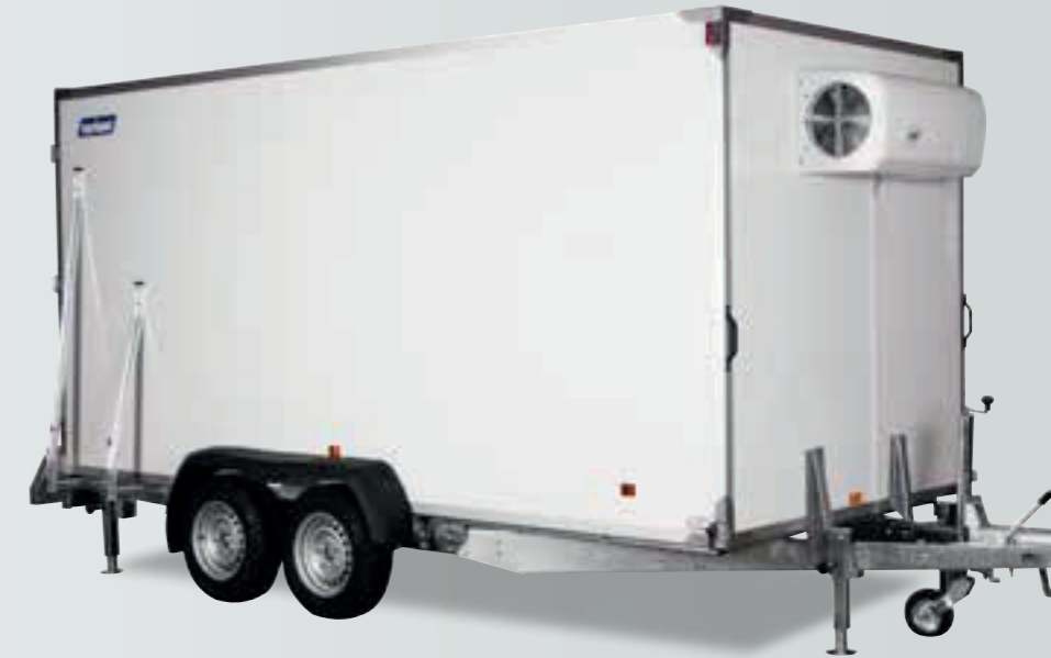
[ Abgeb. Modell 2719 F4 ]

Alle Modelle können von einer Raumtemperatur +10 Grad bis -20 Grad kühlen.